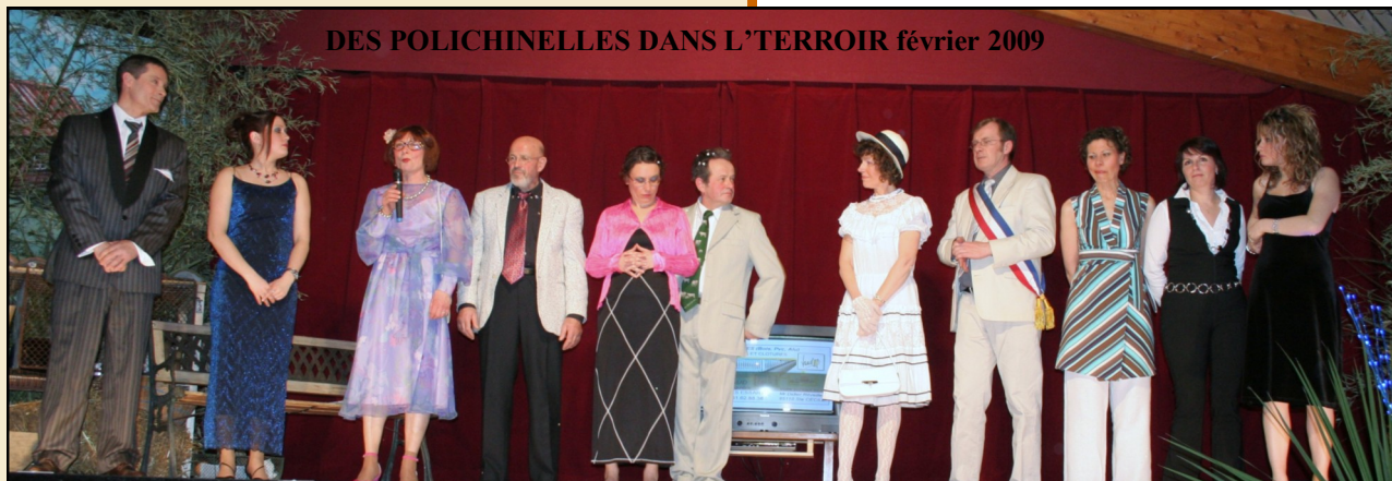
DES POLICHINELLES DANS L'TERROIR février 2009